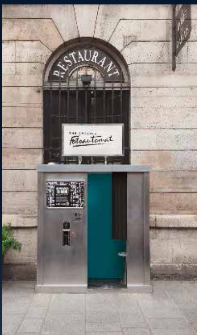
Luminia dans son chalet

• 17 h 30 : animation de l'association O'Vive la Vie, portail sud.