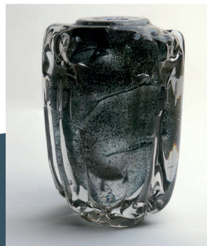
Vase réalisé par Henri Navarre, donation de 1971.

Le XX e siècle est également propice à l'enrichissement du musée : grâce aux donations, comme celle du sculpteur-verrier Henri Navarre en 1971 ; aux datons, celle de Solange Prével-Vlaminck qui constitue les prémices d'une collection de peintures de Vlaminck bien étoffée par la suite ; ou encore des acquisitions. Le musée conserve aussi une collection extra-européenne exemplaire, grandement constituée en 1970 grâce au legs de Louis-Joseph Bouge, gouverneur des territoires d'Outre-mer au début du XIX e siècle.