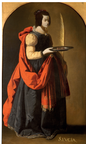
Sainte Lucie de Zurbaran, tableau acquis en 1876.

Auparavant situé dans l'Hôtel Montescot, le musée municipal est créé le 15 mai 1833 sous l'impulsion de François de Villiers. Il rassemble dans un premier temps des objets issus de l'ancien cabinet d'histoire natu-