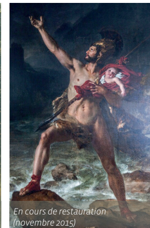
En cours de restauration (novembre 2015)