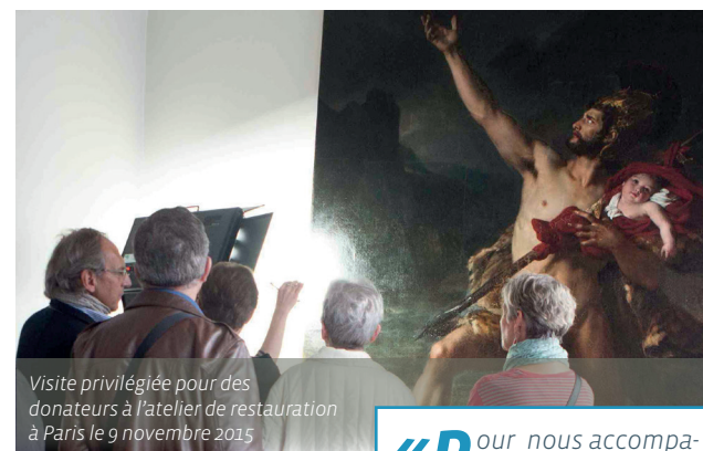
Visite privilégiée pour des donateurs à l'atelier de restauration à Paris le 9 novembre 2015

«Pour nous accompagner dans cette opération nous avons reçu le soutien de l'Association des Amis du musée : une généreuse participation de 2000€»